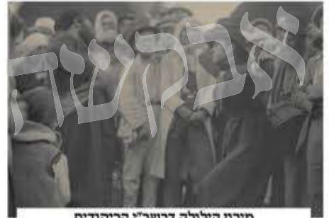
מירון הילולה דרשב"י הריקודים