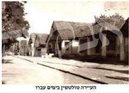
העיירה טולטשין בימים עברו