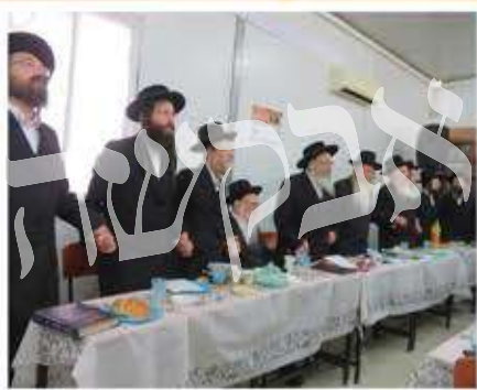
בכנס התבודדות בישיבת מתיבתא

מגדולי יקירי וחשובי אנ"ש בדורינו, מעידים כי הדברים המתוקים ומחיי הנפשות של רבי נתן, הם הם אלו שקירבו באמת לרבינו הקדוש.