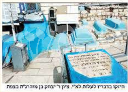
חיקו בדבריו לעלות לא"י. ציון ר' יצחק בן מוהרנ"ת בצפת