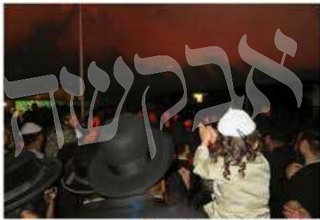
הדלקה אגש דחסידי ברסלב במירון