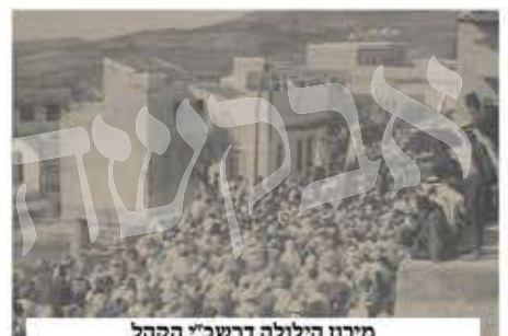
מירון הילולה דרשב"י הקהל