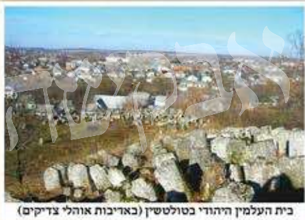
בית העלמין היהודי בטולטשין