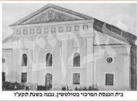
בית הכנסת המרכזי בטולטשין, נבנה בשנת תקע"ו