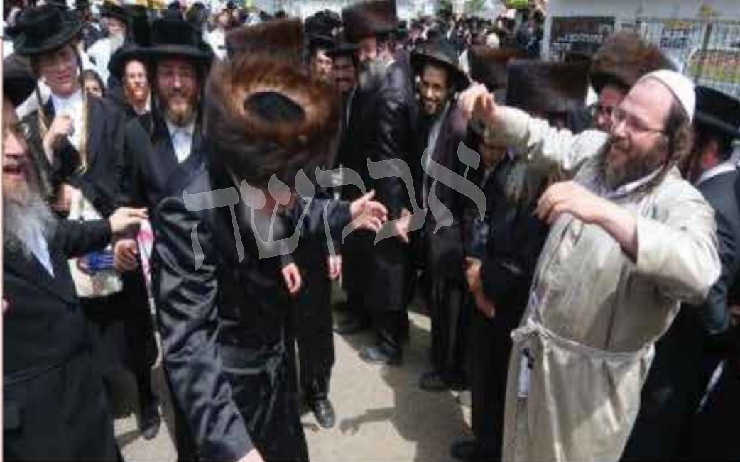
סידור בסלב במירון אחה"צ