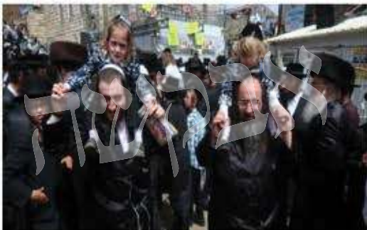
חסידי ברסלב במירון אה"צ