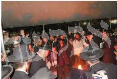
הדלקה אגש דחסידי ברסלב במירון