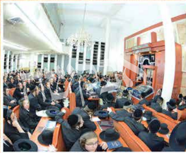
נושא דברים בישיבת ברסלב בני ברק