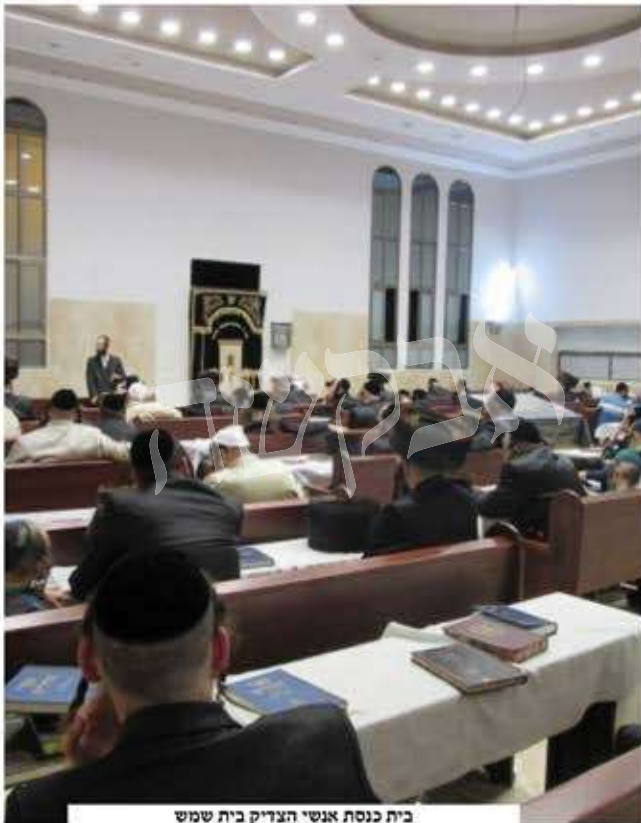
בית כנסת אנשי הצדיק בית שמש

התפללתי גם על זה, וב"ה בהמשך זכיתי שנוות ביתי שכנעה נשים רבות בחנות בה היא עובדת, שישלחו אף הן את בעליהן לרבינו על ראש השנה בלי מניעות, וכמה וכמה זכו להגיע לרבי בזכות זה.