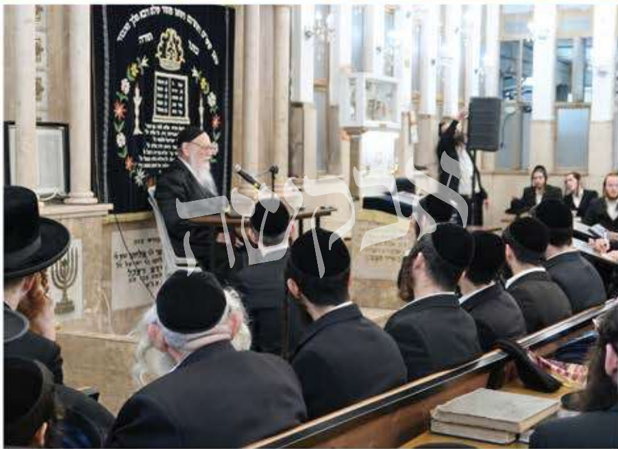
נושא דברים בביהכנסת ברסלב מיימון

השתדלנו ככל יכולתנו שלא לפאר אנשים ומעשים, שהרי רק הוא יתברך יודע את