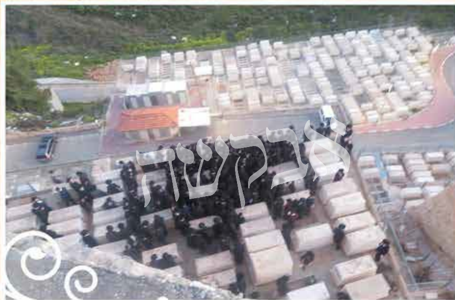
ותשחק ליום אחרון - מטמינים את גופתו הטהורה