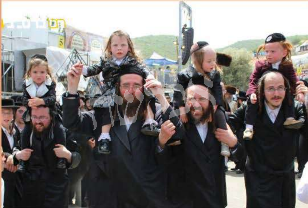
ילדי חלאקה על גבי הוריהם בריקודים במירון