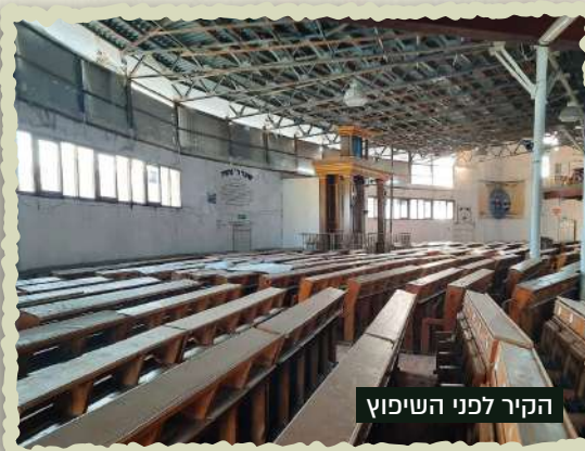
הקיר לפני השיפוץ

אנשי הפקה ותחזוקה, בעלות של אלפי דולרים. צריכים מערך של עובדי תחזוקה ונקיון בימי