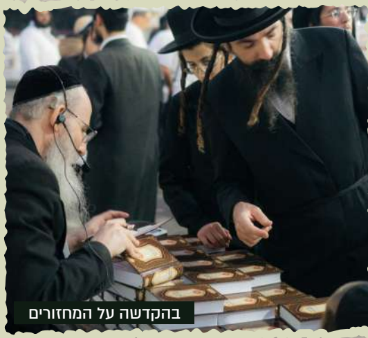
בהקדשה על המחזורים

אנו מקווים שהציבור יירתם בחפץ לב וייתן לנו את הכוחות להוציא את הרצונות הגדולים הללו הלכה למעשה.