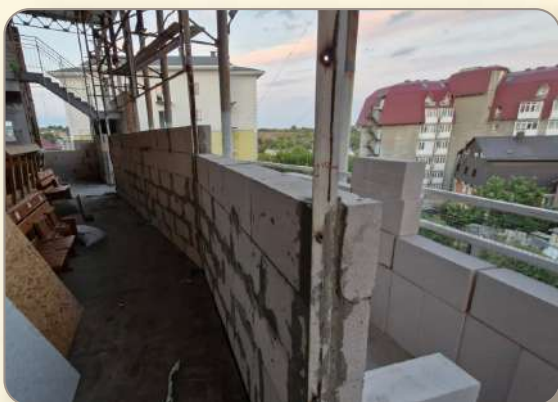
עבודת הבניה ערב ר"ה תשפ"ה