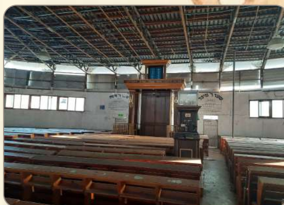
כותל המזרח הישן