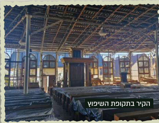
הקיר בתקופת השיפוץ