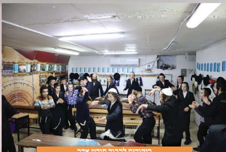
ריקודים לכבוד חודש אדר