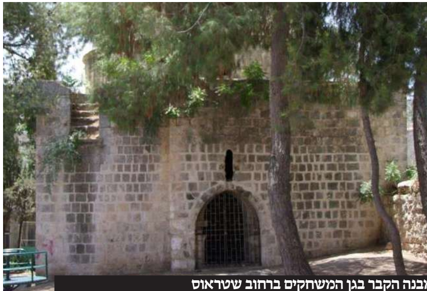
מבנה הקבר בגן המשחקים ברחוב שטראוס

ב"ספר הישר" שמופיעים בו סיפורי האבות והשבטים.