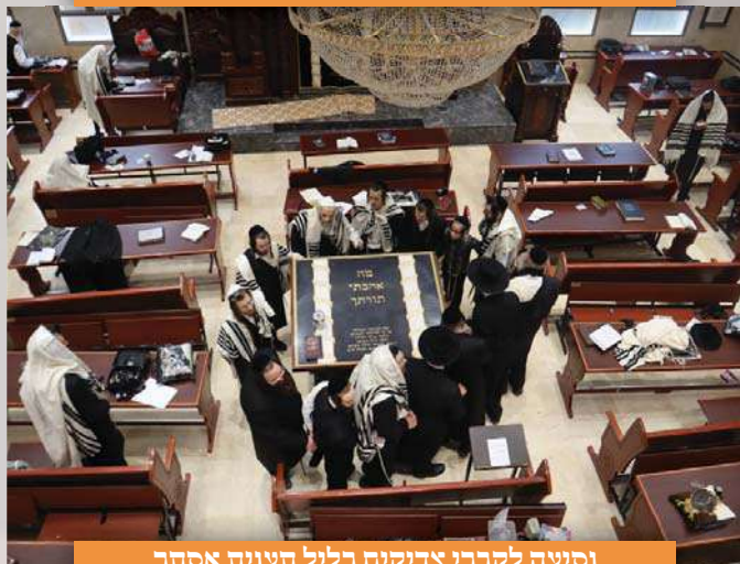
נסיעה לקברי צדיקים בליל תענית אסתר