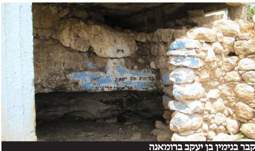
קבר בנימין בן יעקב ברומאנה

חצר גדולה ובה אולם למתפללים". קבר זה מובא גם בספר טוב ירושלים: "אנטיפטורס, כפר סבא, הערבים מראים שם קבר בנימין בן יעקב". וכן בספר יחוס הצדיקים ועוד.