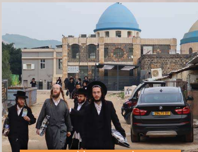
נסיעה לקברי צדיקים בליל פורים קטן