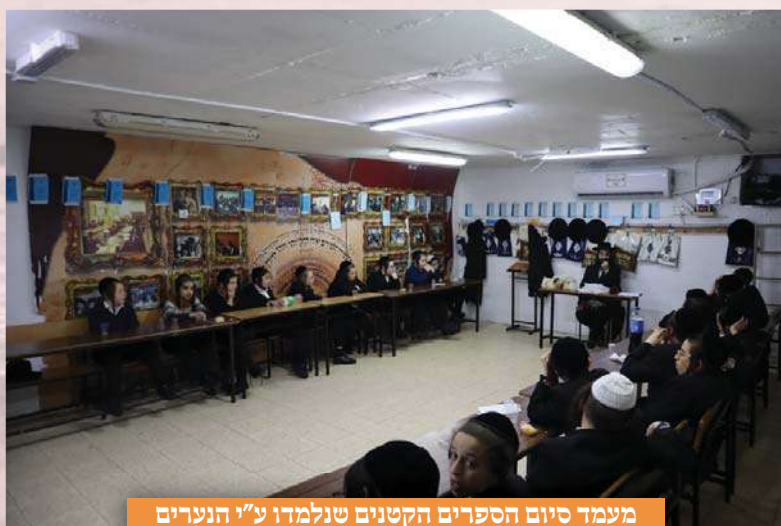
מעמד סיום הספרים הקטנים שנלמדו ע"י הנערים