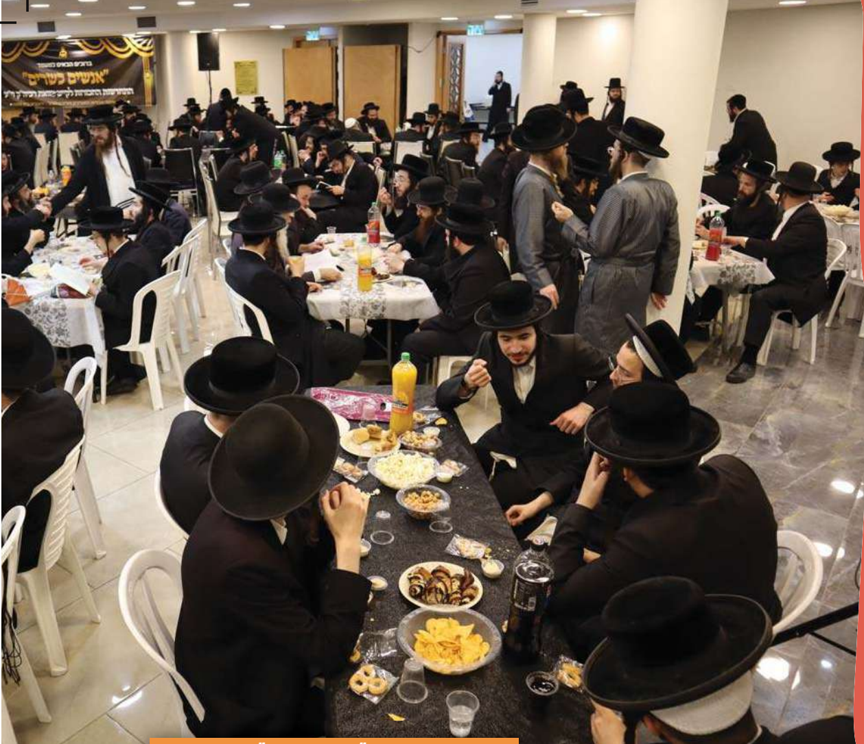
מעמד "אנשים כשרים"