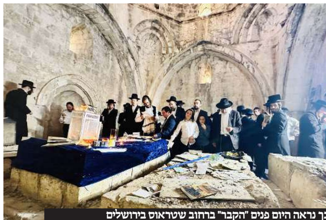
כך נראה היום פנים "הקבר" ברחוב שטראוס בירושלים

דרך אומרם ז"ל (ספר הישר פ' וישב) כי קודם ששלחו בו חבלות והצרו לו. אולם אין בכך ראייה, כי המילים בסוגריים נוספו רק במהדורות מאוחרות ע"י