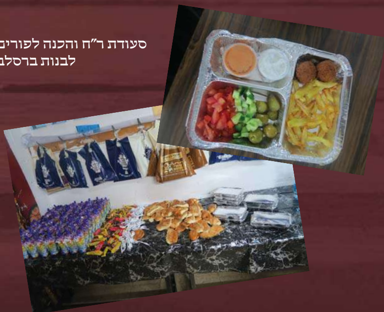
סעודת ר"ח והכנה לפורים לבנות ברסלב