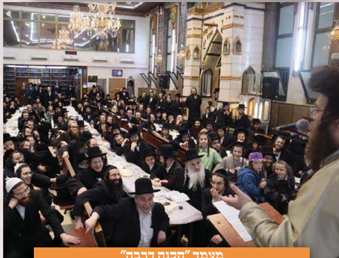
מעמד "הכנה דרבה"