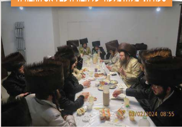
סעודות "מלווה מלכה" כל חבורה עם ראש החבורה