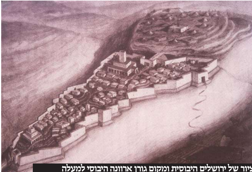
ציור של ירושלים היבוסית ומקום גורן ארוונה היבוסית למעלה