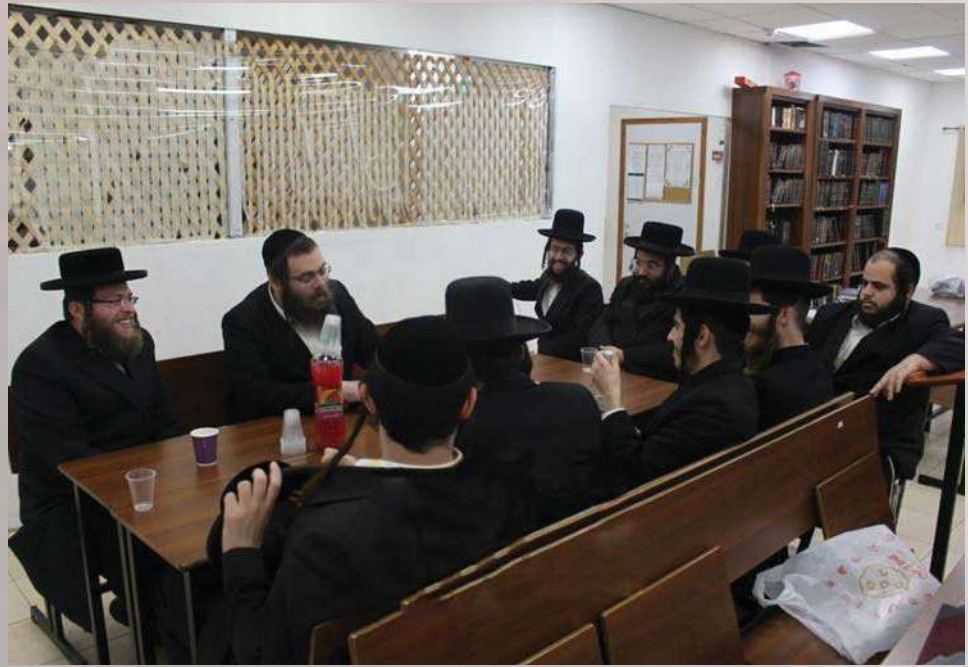
החבורה בהר יונה

התחדשות גוררת התחדשות ופעילות גוררת פעילות... כשנמצאים בעיצומו של חורף ארוך בשנה מעוברת, אסור לתת להזדמנות המיוחדת לחמוק מבין האצבעות. פורים קטן הוא זמן ועת רצון מיוחד, בפרט כאשר הוא חל בליל ששי, והפעילים המסורים אמרו לנצל אותו כראוי לחסידי ברסלב: לערוך נסיעה לקברי הצדיקים קדושים אשר בארץ המה.