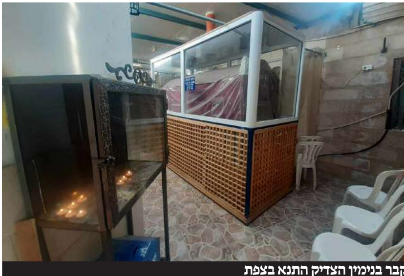
קבר בנימין הצדיק התנא בצפת