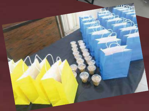
ערכות אישיות עם ארוחה עשירה ב"כינוס הכנה" לנשות ברסלב