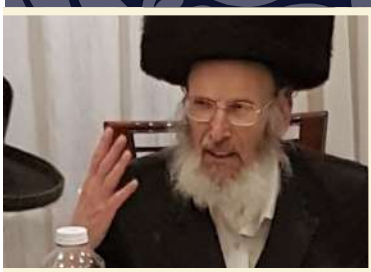
רבי ישראל הירש זצ"ל