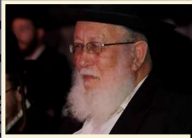
רבי יהודה קיפניס שליט"א