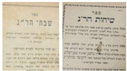
דערווייל האב איך דארט באמערקט א קליין קונטרס וואס פארמאגט אין זיך צוויי ספרים מיט די נעמען: 'שבחי הר"ן' און 'שיחות הר"ן'