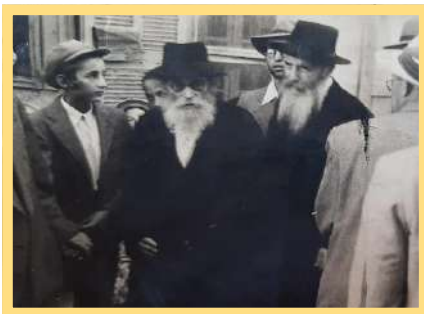
מֶרְן הַחֲזוּ"א זצ"ל