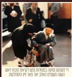
די לעצטע נסיעה במסורת נפש לוקאט קיבוץ ראש השנה תשע"ט האלב יאר פאר זיין היסטאריע