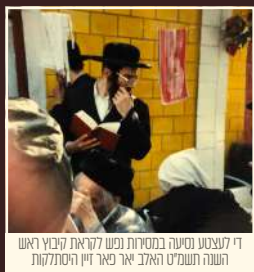
די לעצטע נסיעה במסורת נפש לוקאט קיבוץ ראש השנה תשע"ט האלב יאר פאר זיין היסטאריע