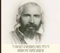
די בילד פארן פאספארט לוקאט די ערשטע נסיעה קיין אמאן

אין איינע פון די טעג בין איך אריין אין היכל התורה אויפן פושקינא גאס. עס איז געווען פול פון וואנט צו וואנט מיט לומדים, איך בין אריבער און געטיילט די קארטלעך. אינצווישן האב איך געזען א איד וואס איז