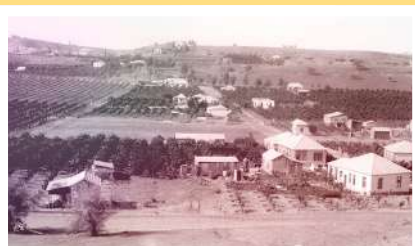
די פעלדער און בני ברק ווי די חבורת הבחורים האבן געמאכט התבודדות