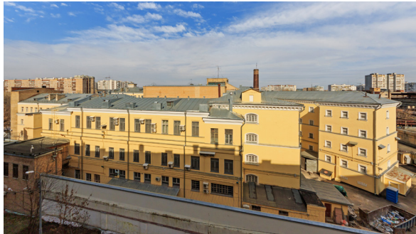
תפיסה אין מאסקווע

ווי מער, "אבער די חסידים לאזן נישט נאך: "הער צו, גיין שוין אהיים, דו ווילסט בלייבן דא ביז די גוים וועלן קומען!"" איך האב זיי