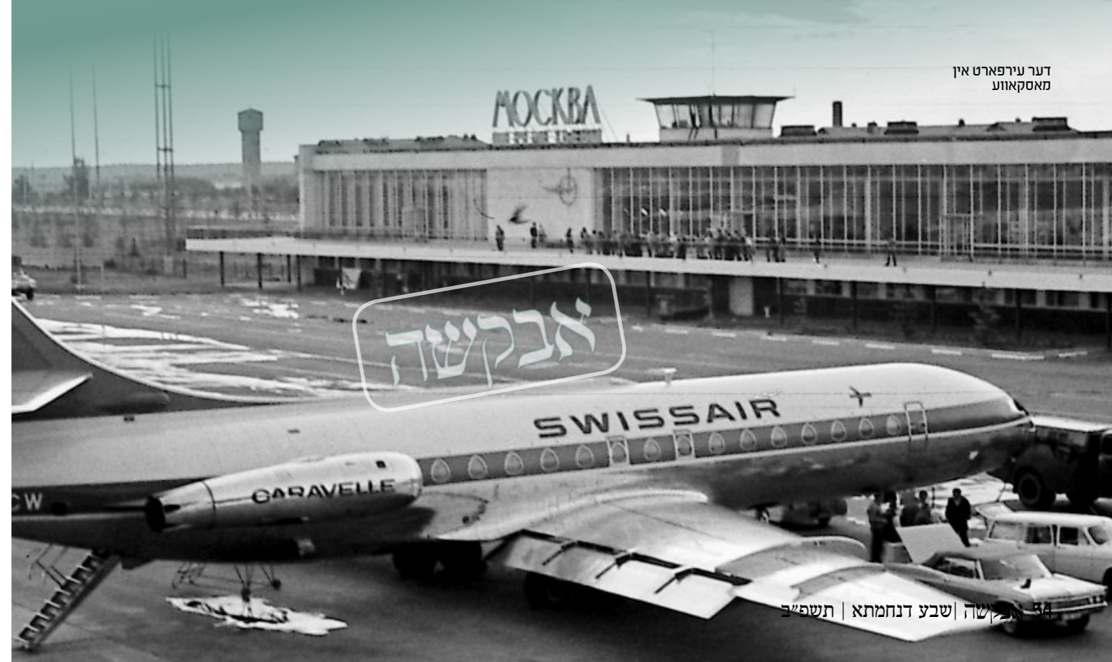
דער עירפארט אין מאסקאווע

"איך וואונטש זיך צו זעהן די לעכטיגקייט פון די וועגן אויף וואס איר פארט אויף זיי צו מיר" (חיי מוהר"ן). די נסיעות פון די ברסלבער חסידים צום ציון הקדוש פון דעם הייליגן רבי'ן איז נישט קיין לערע זאך. אויב איז דאס געווען גילטיג אין דער צייט ווען די ווערטער זענען געזאגט געווארן, איז דאס אין פאקט געווארן פיל-פאכיג מער באדייטנד אין יענע טעג נאך איידער עס האט זיך געשפאלטן דעם אייזערנעם פארהאנג וואס האט פונאדערגעשיידט צווישן די הערצער פון די ברסלבער חסידים אין דער גאנצער וועלט, צום ציון הקדוש וואס האט זיך געפונען אזוי ווייט ווי נאר סיי ווען.