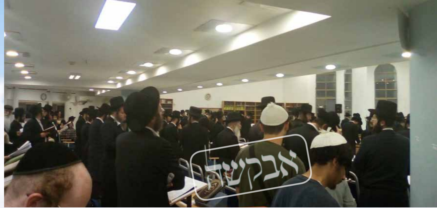
מדובר בעצרת היסטורית כך כולם אמרו. העצרת בעיר צפת

לפניכם סקירה קצרה ומדגמית, עם המארגנים או המשתתפים בכמה מעצרות התפילה ברחבי תבל, מהם תוכלו להקיש על הכלל כולו. ניסינו להציג לפניכם את הסגנונות השונים, על אף שלא נוכל להעביר