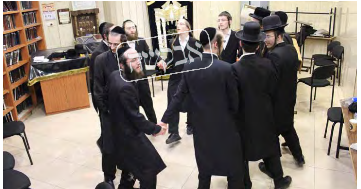
בני החבורה חיזקו כל הזמן. בני החבורה בריקוד עליז