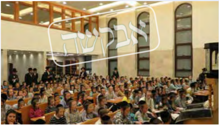
עצרת התפילה לילדים. בית שמש