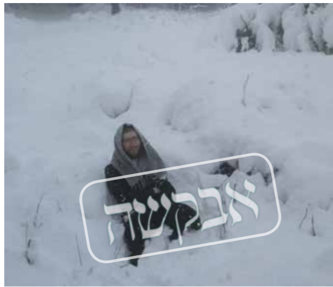
כולם משחקים בשלג והם יושבים ושרים זמירות מתבודד בעיצומה של סופת שלגים

זה היה קשה... שבועיים שלמים בלי לפתוח אף ספר של ברסלב. אבל מאחר שכבר זכרתי הרבה שיחות בע"פ הרהרתי בהם רבות, שהרי רק ללמוד ממש נאסר עלי. הימים הללו עברו עלי במרירות גדולה ולכן החלטתי לנסוע לרבי שוב. נכנסתי ואמרתי: אני מרגיש שחסרים לי הספרים של ברסלב ומה אעשה? אך אז הבנתי ממנו בצורה יותר ברורה, שלא ללמוד יצאתי משם שבור לגמרי והגעתי לישיבה ממש באפיסת כוחות. החברים מהתחבורה שלו מה קרה? סיפרתי להם את שהבנתי מהתשובה של הרבי, והם אמרו לי שאלו בסך הכל 'מניעות'. התגובה הזאת צרמה לי, באותה תקופה חשבתי ש'מניעות' זה כח שלילי ולא יכולתי ליחס חלילה כזו אמירה לרבי שלי. מאז המשכתי להשתתף בחבורה ובמלווה מלכה אך לא יכולתי כביכול לפתוח ספרים. כולם מאוד חזקו אותי ובזמירות של מוצאי שבת כאשר בני החבורה הגיעו למילים 'פתח לי שער המנוטל' מתוך הזמר של המבדיל בין קודש לחול, חזרו על קטע זה כמה וכמה פעמים. הימים היו ימי חודש תמוז והמחשבות הלכו והתחזקו אצלי שאני צריך לחפש את האמת שלי, לבקש את מה שנכון לנשמה שלי, את התרופה הפרטית שלה. ולכן התחזקה אצלי יותר ויותר ההבנה שמקומי אצל רבי נחמן מברסלב, שהרי העצות שלו כל כך מדברות אלי ונראה שדווקא הוא יכול לעזור לי באמת.