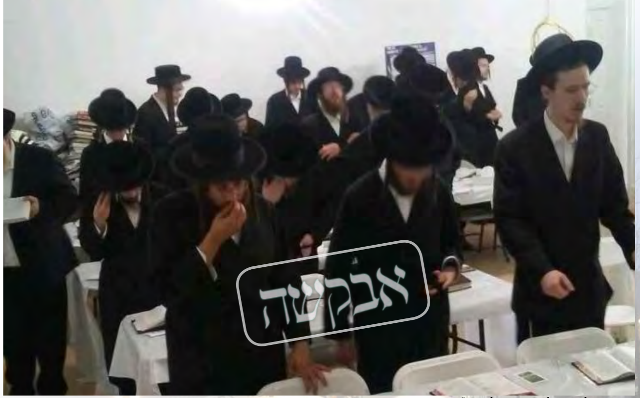
עצרת התפילה סוואן לעיק קנטסקילס ארה"ב