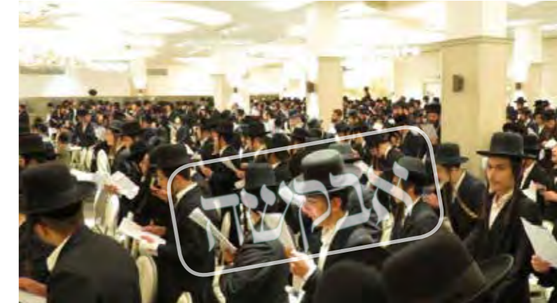
הרגישו כמו בתפילת נעילה. העצרת בעיר ביתר עליית

כאן המקום להודות להנהלת החברות ולמשגיחים המסורים שדאגו שהכל יהא על הצד הטוב ביותר ועל המסירות למימון כל ההוצאות. ///