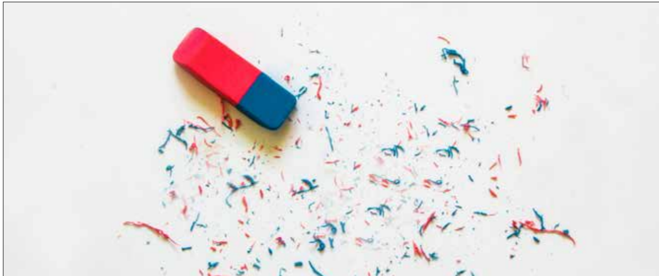
הרי הפעולה הראשונה הנדרשת, מבין כל בר דעת, הינה המחיקה