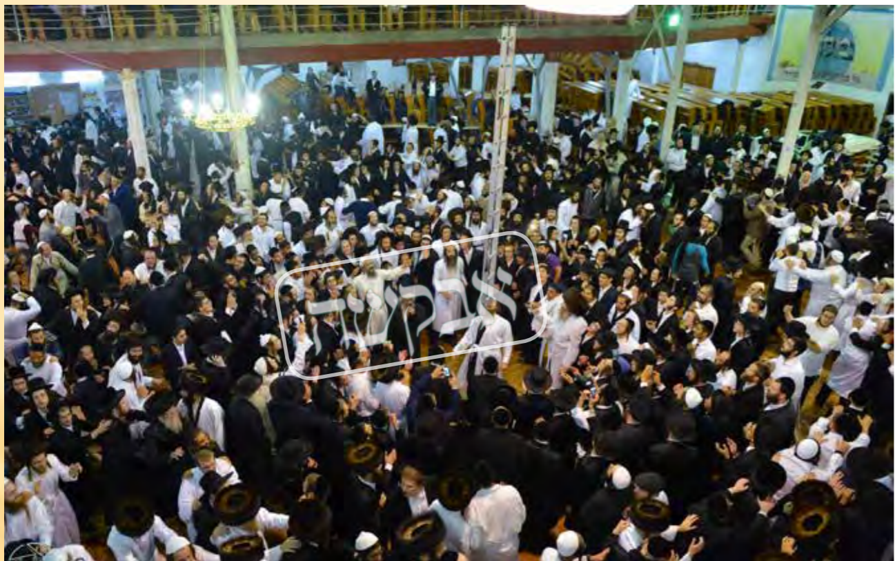
החלום הנכסף להגיע לציון בר"ה. ריקודי השמחה פורצים על השמחה שזכינו להיות בקיבוץ של הרב'ה

ואים בפירוש ממוהרנ"ת שכל מטרות הנסיעה היא להפוך לאיש כשר, כמו שמספר לבנו שנוסע לציוה"ק, "אולי הפעם" יעזור לו הש"י וכבר ייעשה איש כשר וכו'. דומה שנדרש תיקון גדול בדבר בסיסי ויסודי זה. אם ברצונך להביא רבים לאומן, ולשם כך הנך מוכר את התפילין! שבו ואל תעשה עדיף, הנח לו לרבינו שידאג לקרב אליו את נשמות ישראל, ולא זו אף זו שבוודאי שאף לכל צרכיהם הגשמיים ידאג רבינו על הצד היותר טוב, וכמו שאמר בפי' 'שהתבונן כבר על הוצאות הדרך בהליכה ובחזרה', והוא ידאג בוודאי גם לכל אחד שיימצא מקום להניח עליו את ראשו, וכן מקום לסעוד בו סעודת יו"ט... וע"ד שאמר מוהרנ"ת ארץ פסח וועט זיין, ווי נעמט מען דעם פסח אליין? (צרכי הפסח יהיה, אך כיצד לוקחים את הפסח בעצמו?) כלומר, אל תדמה בנפשך שזהו העיקר, גם אם בוודאי ראוי לנו שיהיו מצויים כל צרכי הפסח בהרחבה... ובפירוש אמר רביז"ל כי ר"ה גדול כ"כ עד שכבר אין נפק"מ "יא עסין נישט עסן, יא שלאפן נישט שלאפן" (אם לאכול אם שלא לאכול, אם לישון אם שלא לישון) וכו' וכפי שמציין המעתיק מיד, שכ"ז הוא בבחינת "לא דיברה תורה אלא כנגד יצה"ר"