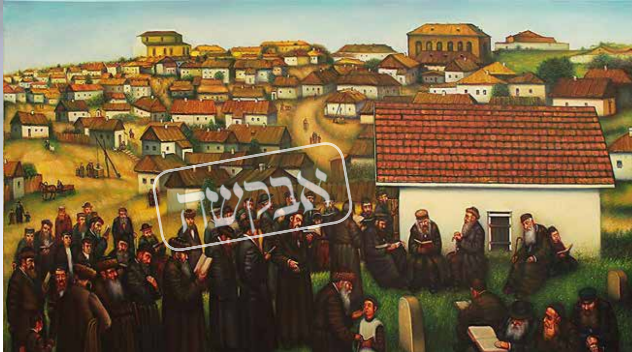
ביותר התגלה עוצם גדולת קדושתו, מעוצם היראה והקדושה שהיה מכניס בכל מי שזכה להתקרב אליו, וכל מי שהיה מדבר עמו בדרך התקרבות, היה נתמלא יראה וקדושה והיה מתלהב מאד מאד להשם יתברך

סדרת מאמרים מיוחדת לעורך לבנינו בגעגועים למקום מנוחת קודשו של רבינו הק' במיוחד לאור המניעות המתגברות על הנסיעה וההשתטחות