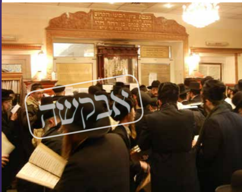
הלב בוער לאור הנעלם. ציון רביז'ל באומן

בצום גדליה התקשרתי לאמי, והיא כבר ממש חיקתה לי. היו מעט עיכובים בנסיעה ובטיסה אבל בחסדי שמים לא התעכבנו מדי. מיד כשנחננו נגשתי לברך 'הגומל' בבית הכנסת שבשדה התעופה. ואמי מרוב ציפייה התעכבה בבית ולא יצאה לעבודתה. כשהגעתי היא קיבלה את פניי בשמחה ובכבי. והוסיפה לתאר את הבכיות שהיו לה ברה"ב במילים 'הבן יקיר לי אפרים'. בתגובה עניתי לה בכבוד גדול, וסיפרתי לה כיצד הנסיעה הועילה לי לנשמה וכמה חיות וחיוק קיבלתי. לפני כן התפללתי רבות לה' שיתן לי את המילים הנכונות מה לומר ומה לא לומר. בסיעתא דשמיא תפילתי התקבלה, והיא אכן הייתה הרבה יותר רגועה ומפויסת.