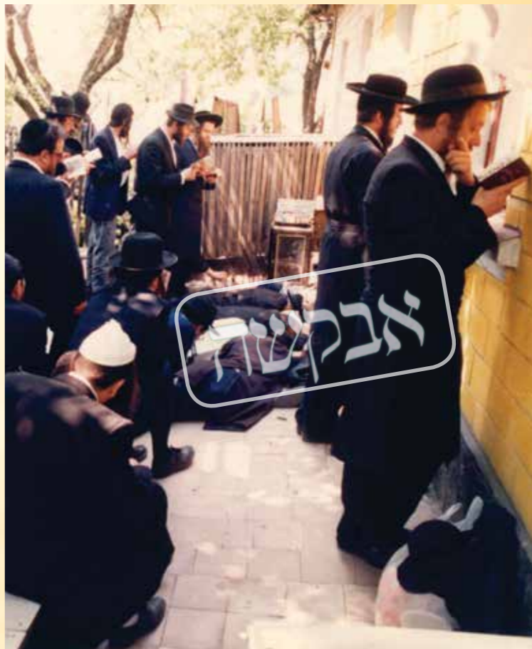
אנ"ש ידעו תמיד שהם נוסעים למקום ללא שום גשמיות. הקיבוץ באומן תש"ן

אמנם, אם נחזור מעט יותר אחורה, אף לאחר שנות השלטון הקומוניסטי שהיה במלא עוזו, בתקופה של לפני פחות משלושים שנה, הרי שהעניינים התנהלו בצורה אחרת לחלוטין. היה זה דבר פשוט לכל בר דעת שהנסיעה לאומן איננה דבר של מה בכך. איש לא ידע מה ילד יום, וממילא גם אם ה"חלום הנכסף" היה להגיע לאומן בר"ה, אולם ה"חלום המציאותי" יותר היה להגיע עכ"פ פעם אחת