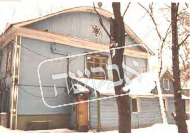
דער בית הכנסת מארינא ראשצע ווי עס האט אויסגעקוקט אין יענע טעג

שוין אין לופטפעלד האבן זיך אנגעהויבן די מניעות ווען אנשטאט זיי צו פאררעדענען וואו צו ווארטן אויפן פליגער, האט מען זיי אנגעהויבן ארומצושלעפן פון דא צו דארט, אהין און אהער. אין יענער צייט, איידער עס האט נאך עקזעסטרירט די עלעקטעראנישע שילדן מיט אלע אינפארמאציע אויף יעדן פליגער, האט די חבורה זיך געמוזט ארומדרייען א לאנגע שעה אין דעם לאנג שטרעקליגן