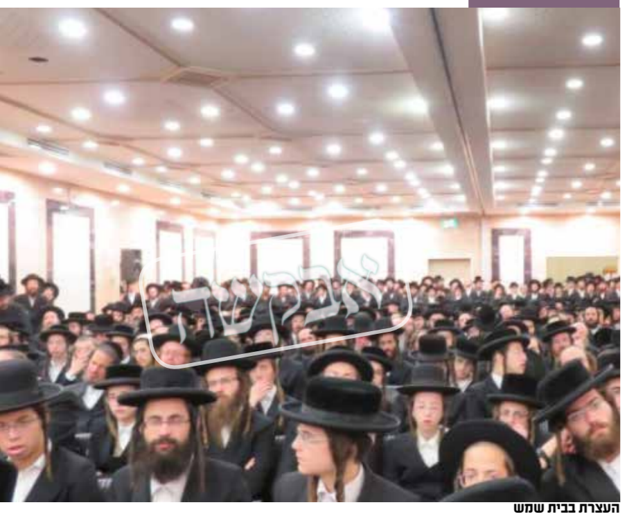
העצרת בבית שמש

הדפסנו גם חמש מאות כרוזים על ראש השנה, והפצנו אותם בכל האזור בס"ד.