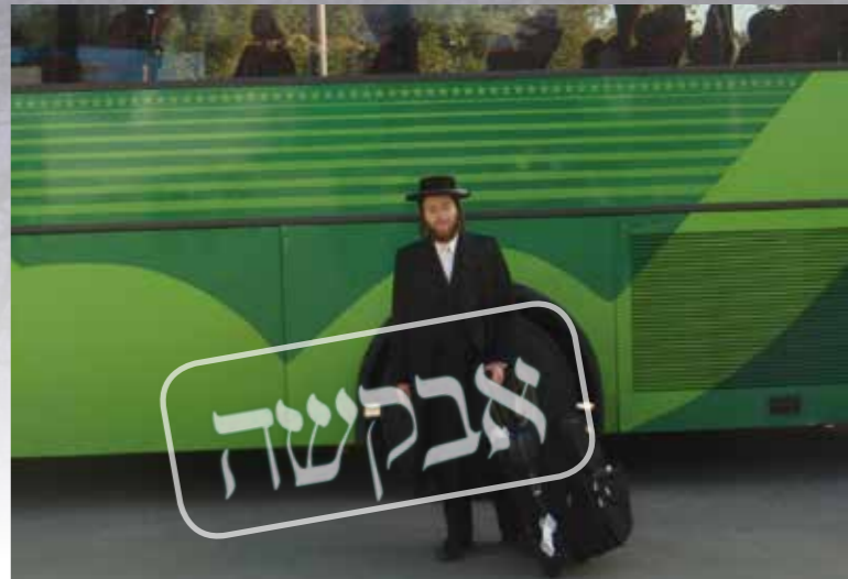
התחלתי לבכות כפי שלא ידעתי מעולם. ר' אפרים בנסיעתו הראשונה לאומן

באותו יום אחרי הצהריים, התקשרתי הביתה. דיברתי עם אימי באריכות עד