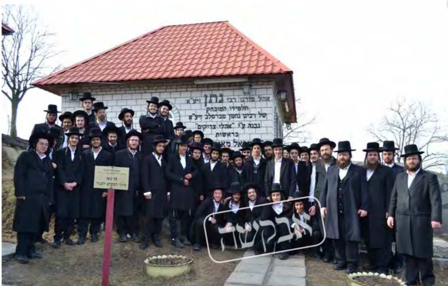
כל יום יש שתי שמחות בחורי הישיבה עומדים בסמוך לציונו של מוהרנ"ת בניסיעה לקברי צדיקים

מיד לאחר שנזרקנו לרחוב הוצאתי את חסכוני ואמרתי להם; "אל דאגה, רביז"ל אמר מה לכם לדאוג מאחר שאני הולך לפניכם, ולפיכך אני מכריז על פתיחתו של "כולל אברכים" עבור כולנו