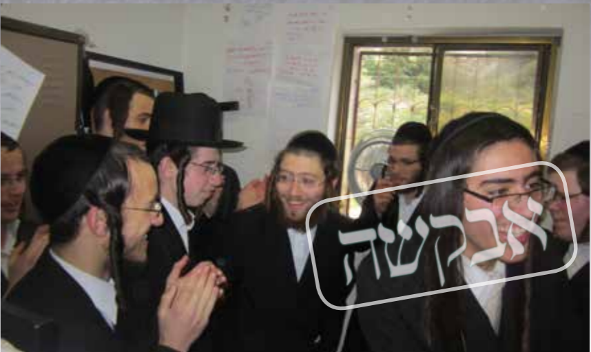
לולא זה מי יודע היכן הייתי היום. בעידן דחוקות יחד עם בני החבורה