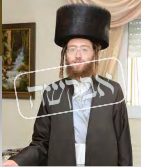
הרגשתי שרבינו הוא היה השדכן שלי. לאחר החתונה