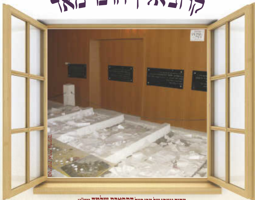
מקום גנוזתו של מרן בעל התפארת שלמה זיע"א